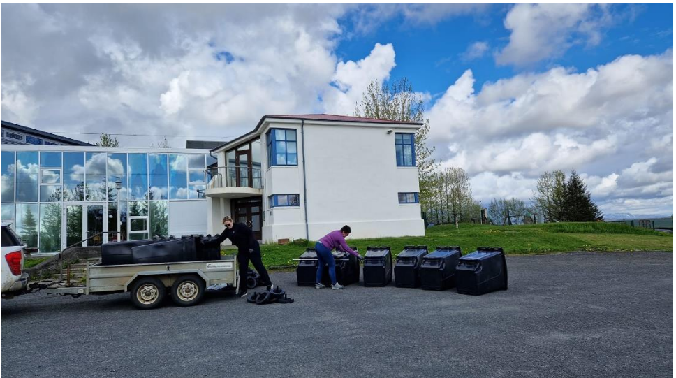
Vaskar kvenfélagskonur setja saman ruslatunnur fyrir framan Leikskólann.