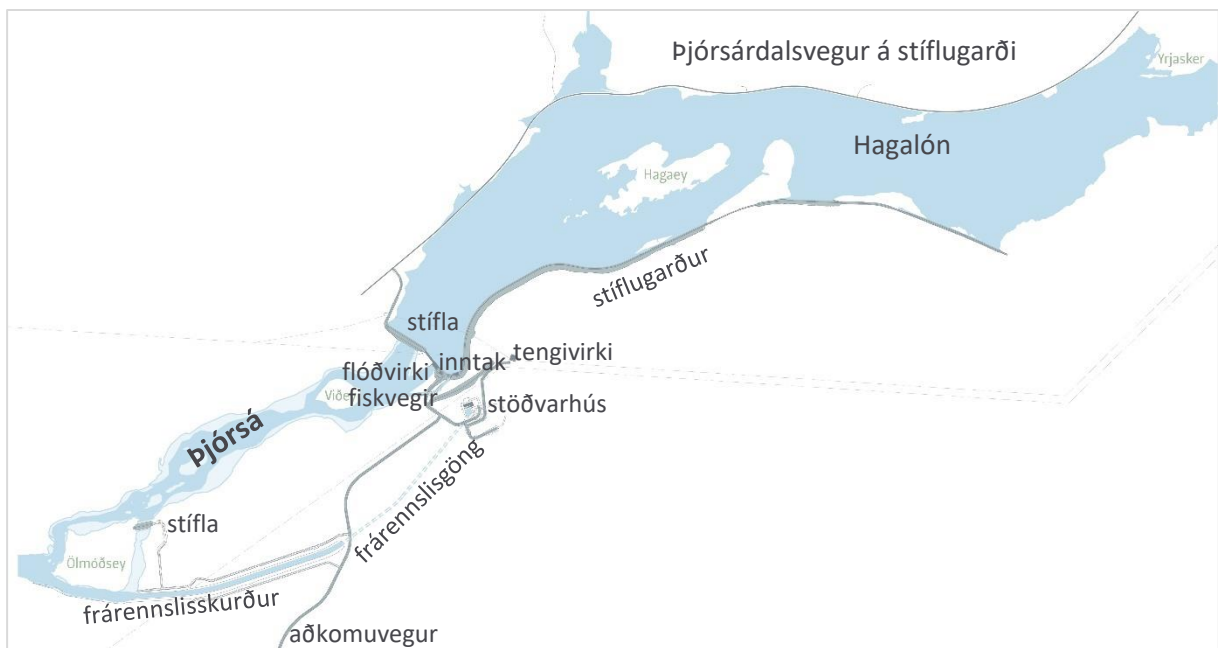
MYND 1 Helstu mannvirki fyrirhugaðrar Hvammsvirkjunar.

Á mynd 1 má sjá helstu mannvirki fyrirhugaðrar Hvammsvirkjunar og tafla 1 sýnir helstu kennistærðir virkjunarinnar. Stærri mynd má sjá á meðfylgjandi teikningum og deiliskipulagsupprætti í fylgiskjölum.