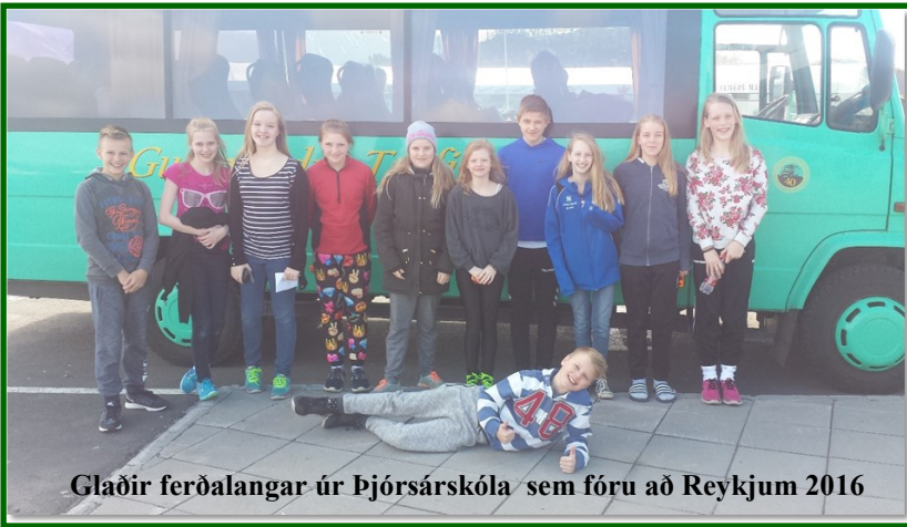
Glaðir ferðalangar úr Þjórsárskóla sem fóru að Reykjum 2016