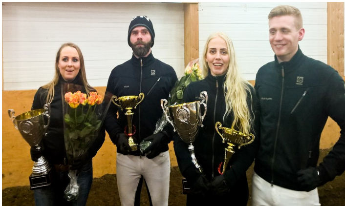
Hrosshagi / Sunnuhvoll Sigurvegarar Uppsveitadeildarinnar 2016.