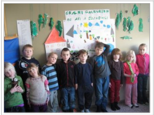
1. bekkur og grænir gaukar

Skólakeppni Stóru Upplestrarkeppninnar í 7. bekk verður haldin miðvikudaginn 4. mars og lokahátíð keppninnar fer fram í Árnesi 12. mars kl. 15:00. Allir eru velkomnir að hlusta á nemendur lesa upp ljóð og sögur á þessum hátíðum, sérstaklega er lokahátíðin spennandi og hátíðleg þegar fulltrúar uppsveitaskólanna mætast.