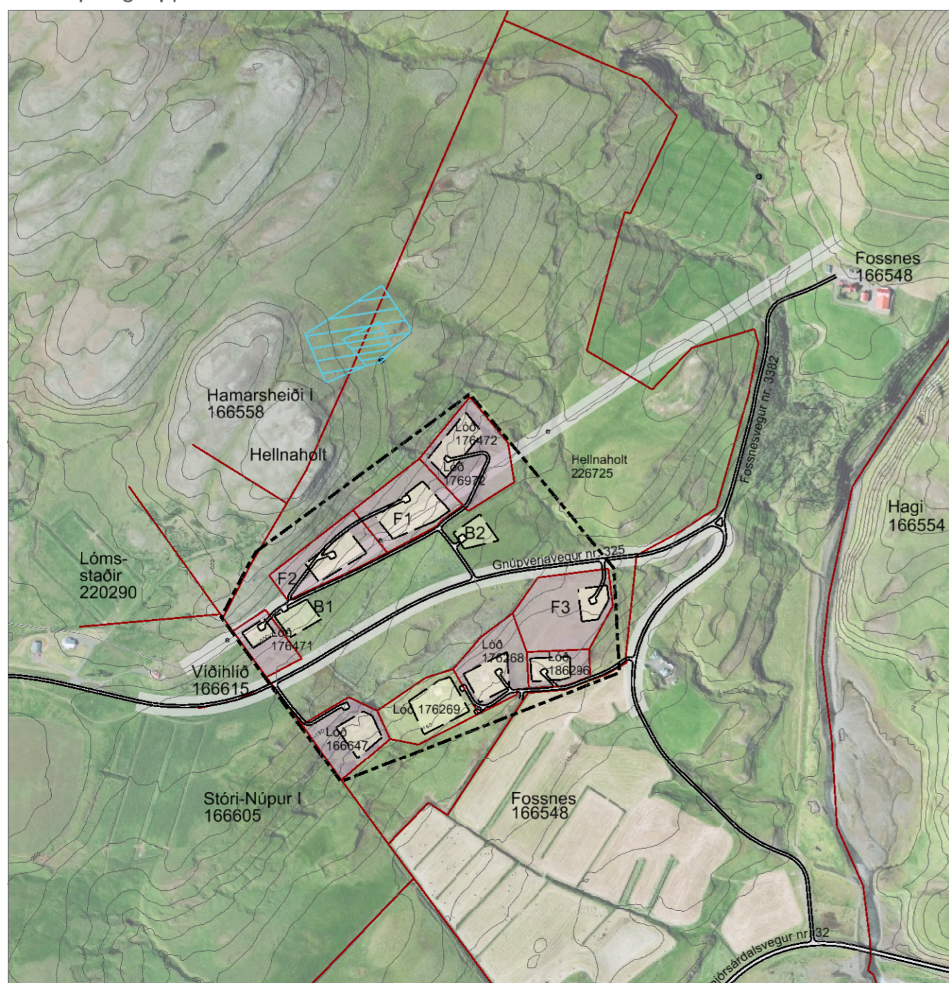
Skýringaruppráttur í mkv. 1:8.000.