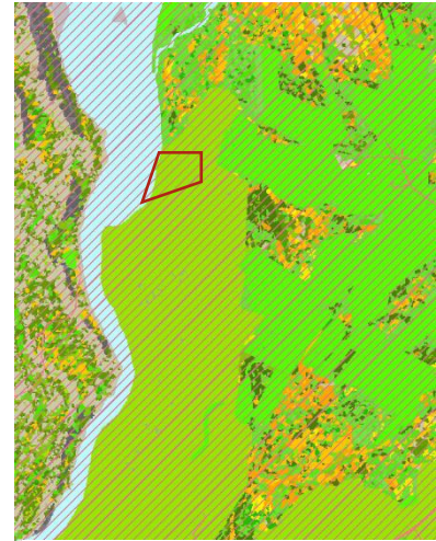
Mynd 1 – Hluti vistgerðarkorts NÍ – rauður rammi sýnir Árhraun 3

Deiliskipulagssvæðið tekur til lands Árhrauns lóðar 3 en allmargar lóðir hafa verið stofnaðar úr landi Árhrauns. Lóðin er 16,4 ha að stærð skv. lóðablaði. Aðkoma að Árhrauni 3 er um heimreið að Ólafsvallar bæjunum og áfram um veg sem liggur að Árhraunslóðum (sjá nánar). Landið er á Þjórsárhraunum, sem eru talin hafa runnið fyrir um 8600 árum og liggja undir stórum hluta sveitarfélagsins. Svæðið er nánast algróið en hraun stendur upp úr á stöku stað og víðast hvar er stutt niður á hraun. Í vistgerðarkortlagningu Náttúrufræðistofnunar er svæðið skilgreint sem mólendi.