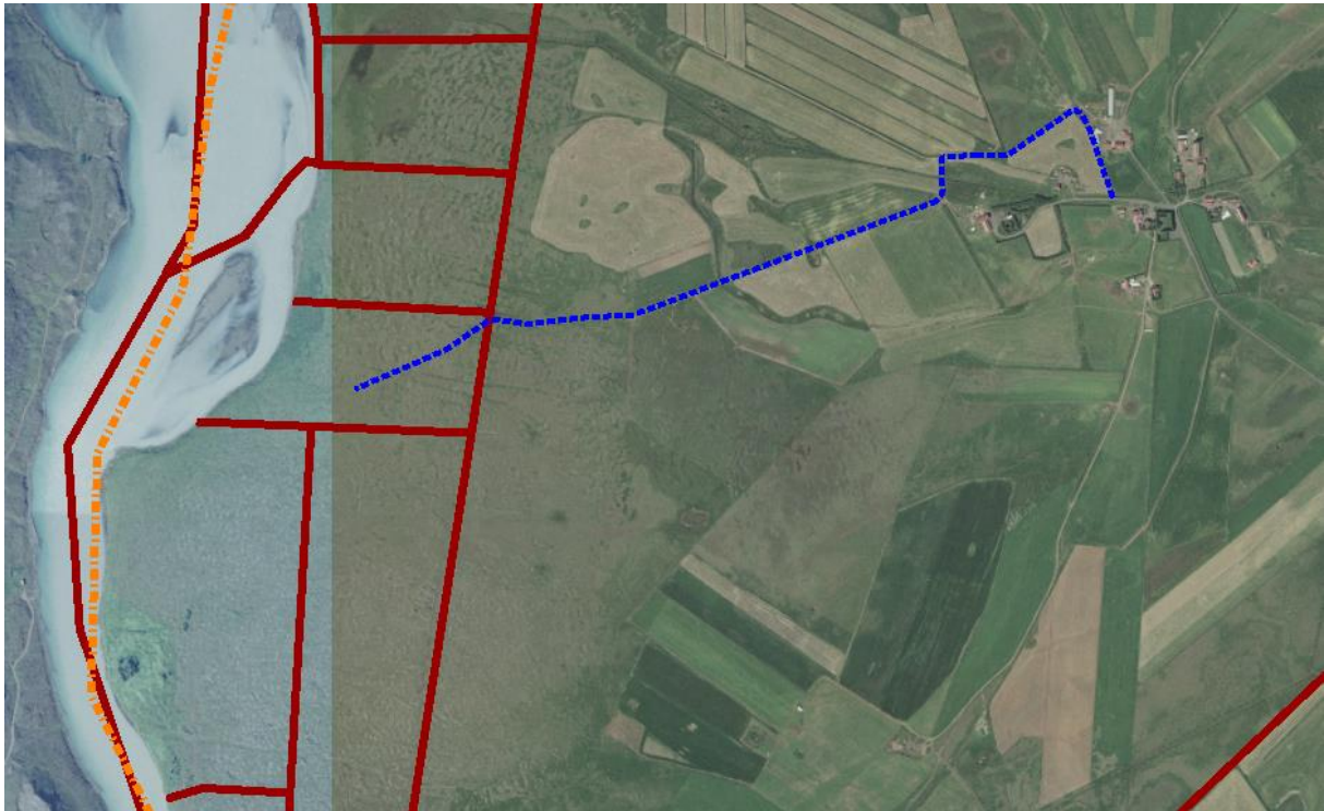
Mynd 3. Möguleg aðkoma frá Ólafsvallarhverfi.

Aðkoma að landinu er um heimreið að Ólafsvallarbæjum og þaðan um veg sem liggur að Árhraunssvæði. Skoða þarf í samráði við Vegagerð, landeigendur og sveitarfélag með góða veltengingu sem nýst getur öllum Árhraunslóðum.