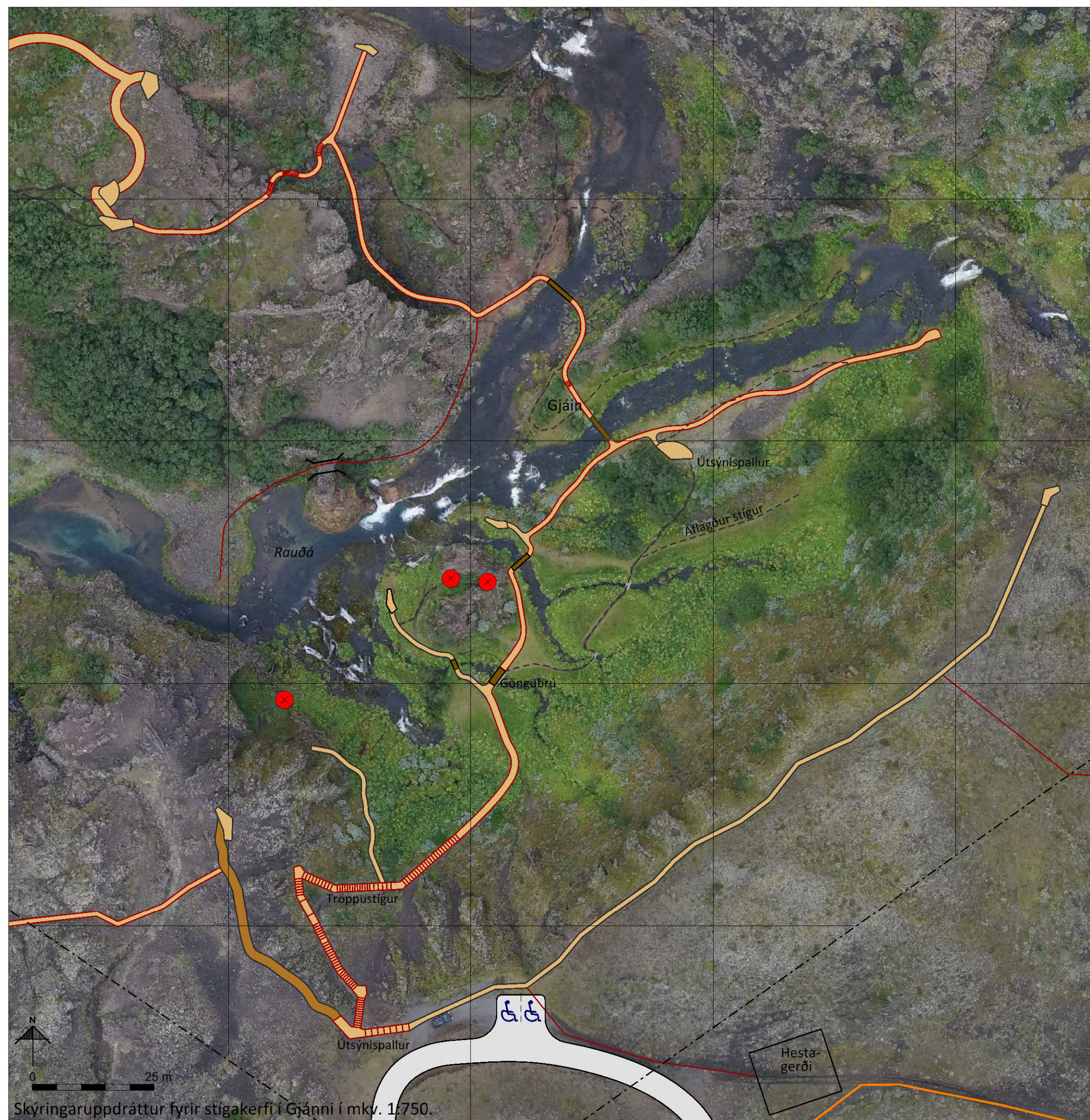
Skýringaruppráttur fyrir stigakerfi í Gjáinni í mkv. 1:750.