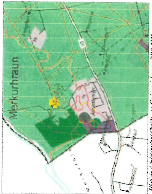
Hluti úr Aðalskipulagi Skeiða- og Gnúpverjahrepps 2017-2029

Skv. lóðarblaði þessu er lóðin 122.400 fm. Lóðin er tekin úr landi Kílhrauns landhr. 191805 Ekkert mannvirkri er á lóðinni.