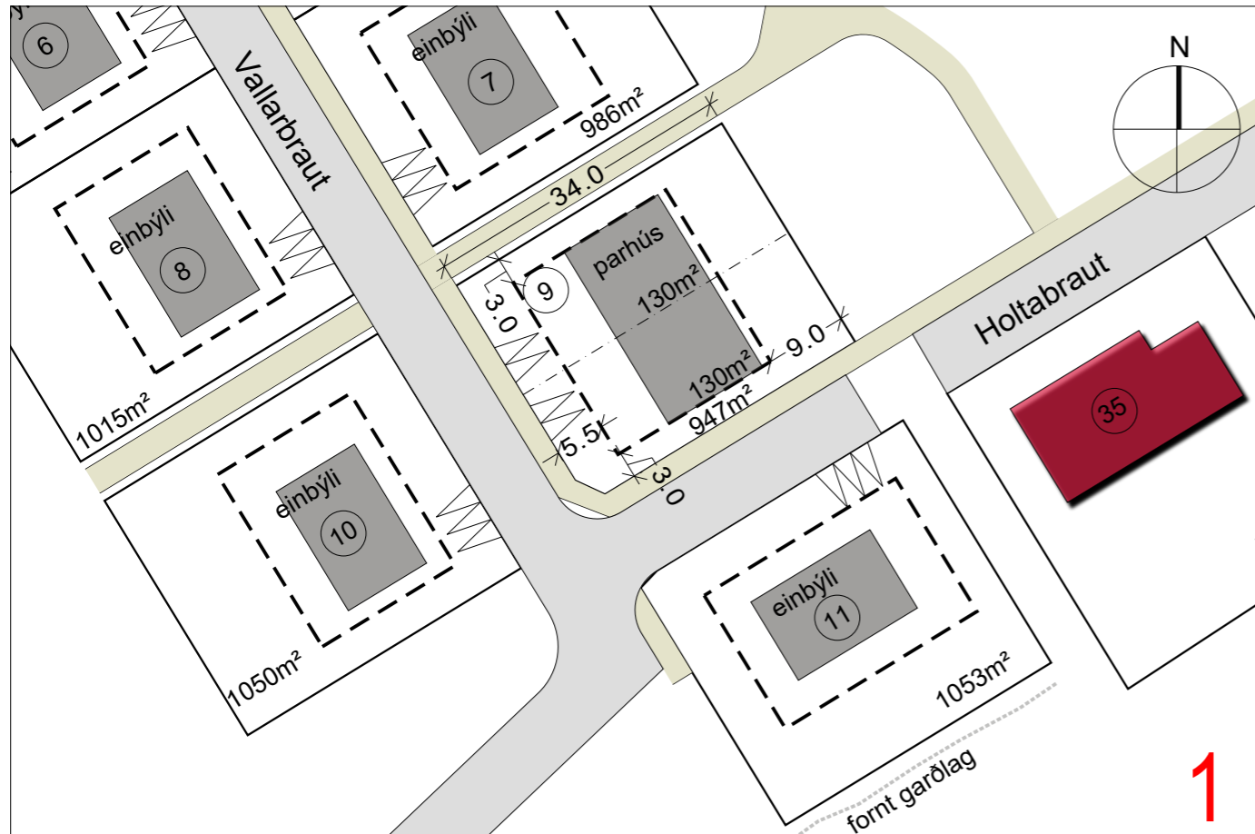
1. TILLAGA AÐ BREYTINGU Á VALLARBRAUT 9 - mkv. 1:750 í A3