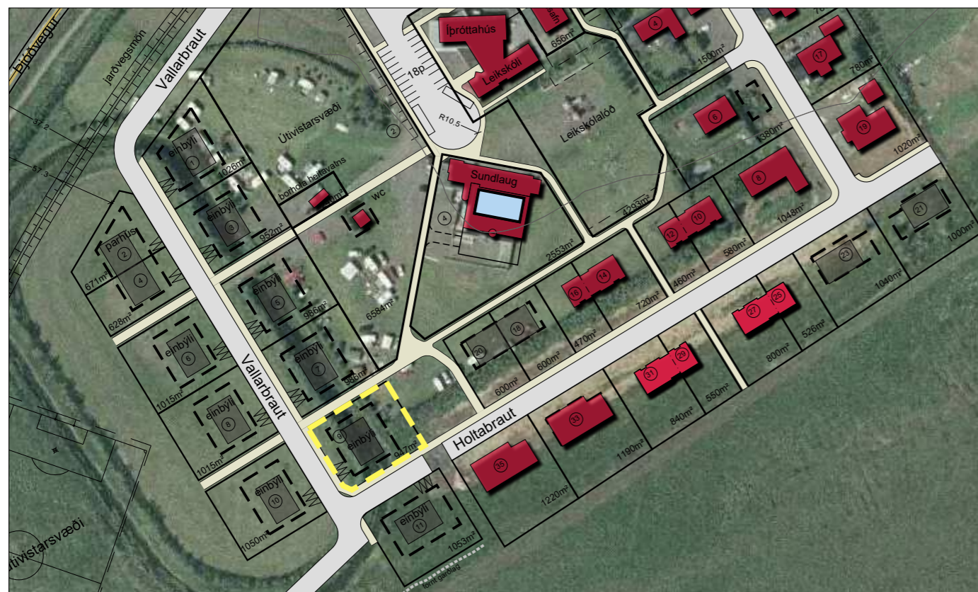
GILDANDI DEILISKIPUAG FYRIR VALLARBRAUT 9 - mkv. 1:1000 í A3